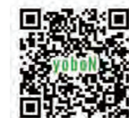
認知症予防ネット神戸 ホームページ

講座や活動の最新情報は、ホームページをご覧ください。チラシなどのダウンロードもできますよ。SNSのお気に入り登録もお願いします。